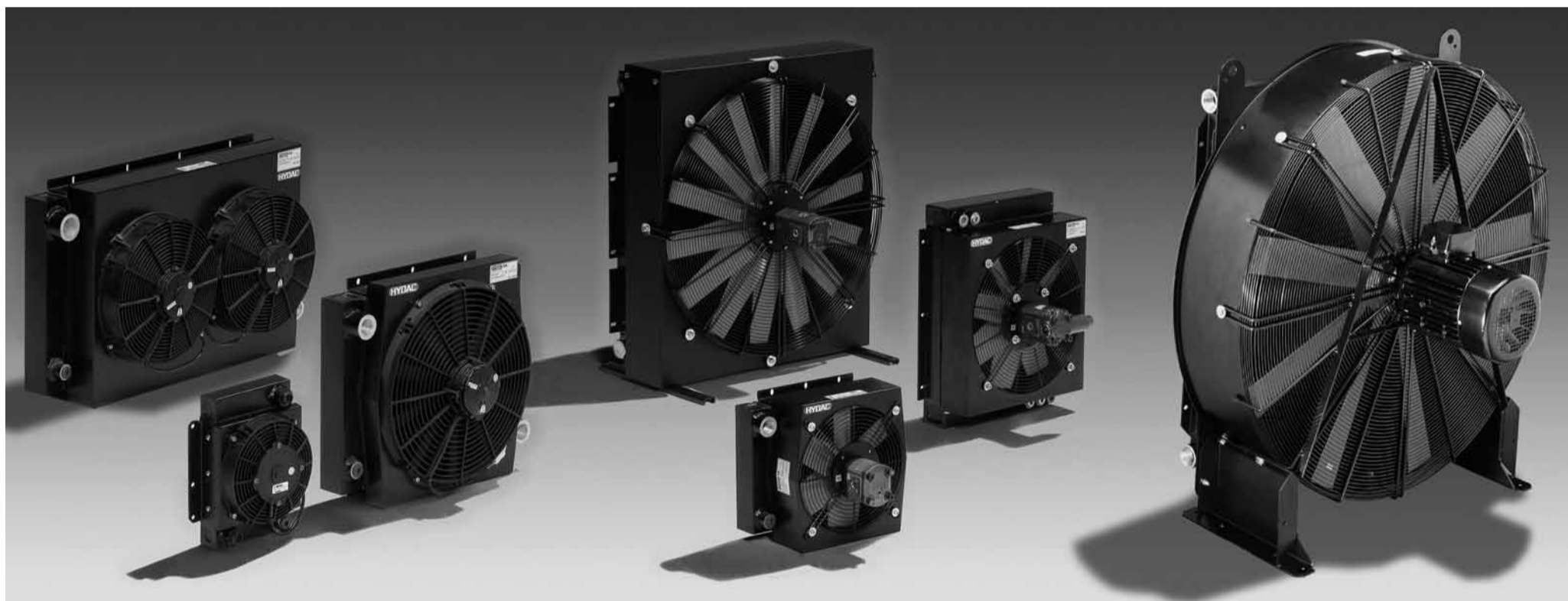
HYDAC luftoljekjølere produseres på vår egen fabrikk i Sveits

De siste fem årene har HYDACs luftoljekjølere gått gjennom en stor forvandling. Produktprogrammet er større enn før, kvaliteten er enda høyere, og vi kan levere teknisk meget gode løsninger for marine- og offshoreapplikasjoner.