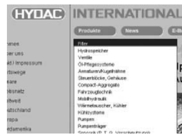
Feste Navigationsbuttons im oberen Bereich, aus der Windows-Oberfläche bekannte Verzeichnisbäume auf der linken Seite: Alles schnell und direkt zu erreichen...

logischen Navigationselementen. Die Bedienung gibt keine Rätsel auf – es ist ganz einfach, sich zurecht zu finden. Im oberen Bereich befinden sich Buttons mit den Menü-Punkten Produkte, News, E-Business, Jobs & Karriere und Unternehmen .