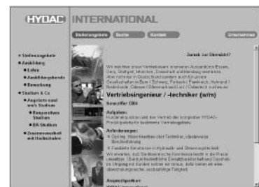
Klar gegliederte Stellenangebote zur direkten Online-Bewerbung oder als ausdrückbare Version für die klassische Bewerbung per Post.

Eine Besonderheit stellt der Abschluss „ Diplom Betriebswirt/-in BA “ dar. Er wird in einer Kombination von Studium und Berufsausbildung erworben und qualifiziert für Führungsaufgaben . In welche Richtung die Ausbildung auch gehen soll: Ein Seitenbesuch lohnt sich allein schon wegen der Tipps fürs Bewerbungsschreiben ; sie sind kompetent und gelten überall.