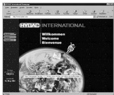
So war's bisher: Die jahrelang bewährte Homepage der HYDAC. Freuen Sie sich jetzt auf das neue Design und die erweiterten Funktionen...

Im August 2003 war die Arbeit geschafft: Die unter der Domain www.hydac.com zu findende Internetseite der HYDAC International GmbH wurde durch eine komplett neu konzipierte Version ersetzt. Und das Neue beschränkt sich beileibe nicht auf ein gefälligeres Design. Das Ziel war vor allem, den Seitenbesuchern mehr Funktionen und eine größere Aktualität zu bieten. Damit steht auch die Internetseite des Unternehmens jetzt ganz im Zeichen des Nutzwerts für den Kunden .