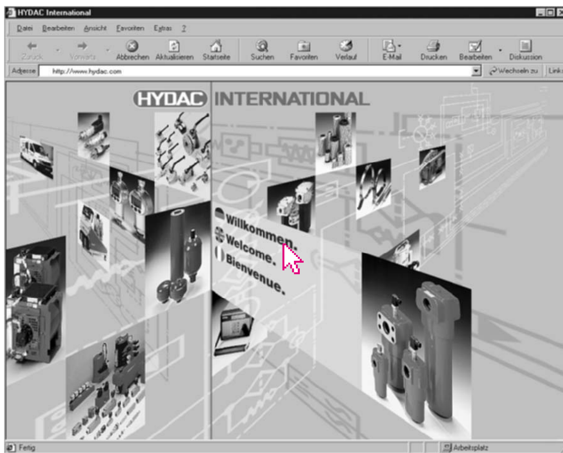
Die Startseite des neuen Internetauftritts: Über die Begrüßung (mit derzeit 3 Sprachen zur Auswahl) gelangen Sie direkt auf die Inhaltssseiten, die klar strukturiert sind und eine schnelle Orientierung auch für erstmalige Benutzer erlauben.