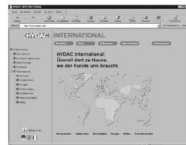
HYDAC International GmbH: alle Ansprechpartner und Adressen der Niederlassungen und Vertriebspartner auf einen Klick.

Mit einem Klick ist man bei der gesuchten Information!