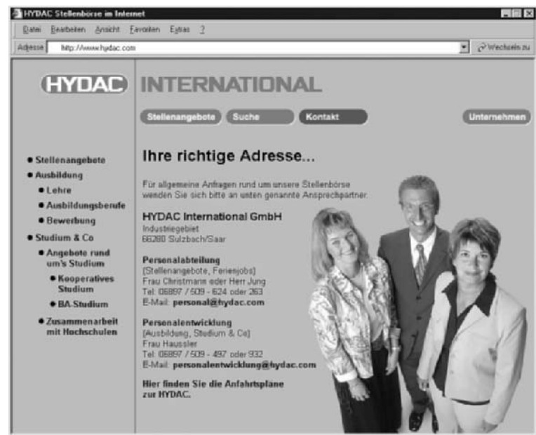
Persönliche Ansprechpartner bei den Stellenangeboten...

Klar, dass die Internetseite sich aber nicht nur an Ausbildungsplatzsuchende und Studierende wendet. Ständig findet man hier Stellenanzeigen für verschiedene Berufszweige und Einsatzorte. Schon zu Zeiten der alten Homepage war das Internet für die HYDAC International GmbH ein