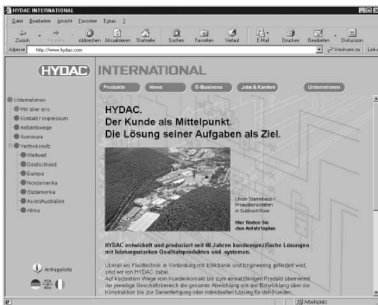
Wir begrüßen Sie mit der Vorstellung unseres Unternehmens und Ihren Ansprechpartnern, damit Sie wissen, mit wem Sie es zu tun haben...

In drei Sprachen lädt die neue Seite Besucherinnen und Besucher ein, sich umzusehen: Willkommen, Welcome, Bienvenue... Internationalität gehört bei HYDAC einfach dazu, denn die Produkte kommen auf allen Kontinenten zum Einsatz. Sprachbarrieren gibt es nicht: Den Kunden auf dem deutschen Heimatmarkt spricht die Seite ebenso in seiner Sprache an, wie die französischen Nachbarn und die